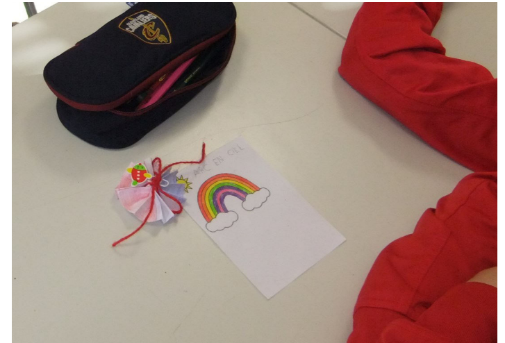
Classe 1B secondaria