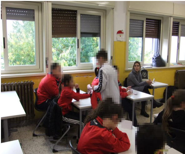
Classe 1A secondaria